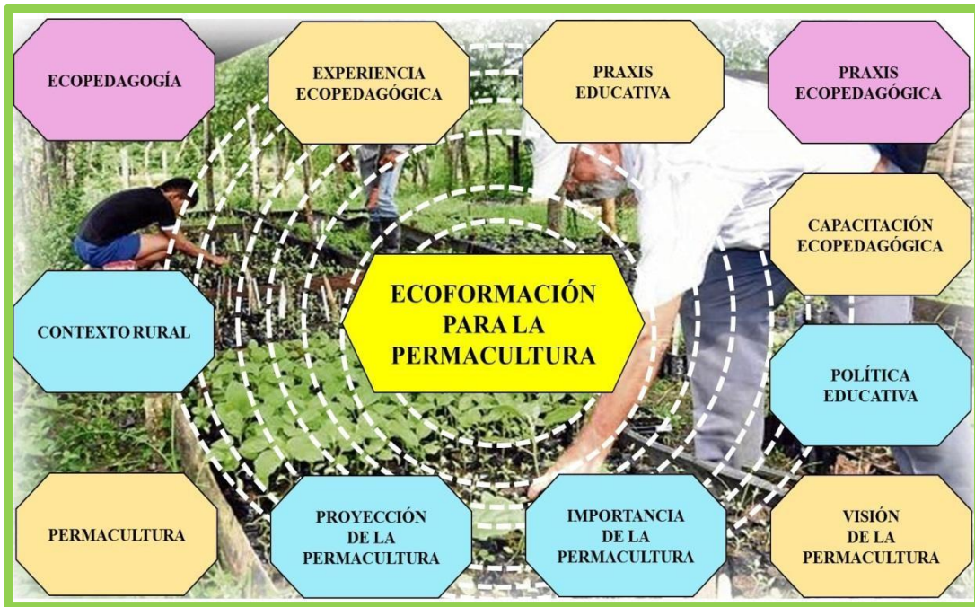
Gráfico 13 Holograma de la Realidad Encontrada a través de las Categorías Emergentes

La información obtenida de las entrevistas a los informantes clave, se estructuró en siete (11), categorías emergentes, siendo estas: