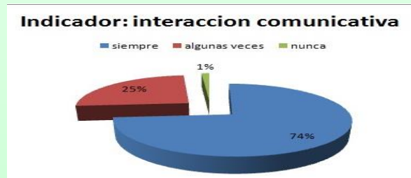
Grafico 1. Distribución de frecuencia porcentual promedio de la variable Participación. Indicador: Interacción Comunicativa

En los ítems anteriores se detectó que el 68% de los representantes de la muestra, siempre se entrevistan con el docente de su hijo, de igual forma el 79% siempre considera que la escuela mantiene un proceso de comunicación efectiva con los representantes para la planificación de las actividades.