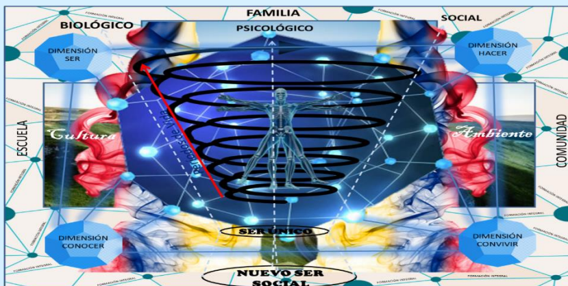
Gráfico 1. Representación Holográfica del Entramado Teórico en Gestión Educativa.

Seguidamente, en su parte cultural, va a estar formada por un cúmulo de creencias, religiones, tradiciones y costumbres que moldearán su identidad. De esta manera, a través de una formación integral, transdisciplinaria, holística que articule y fomente la relación entre la Familia-Escuela-Comunidad es como se puede obtener al nuevo ser social que dé respuestas a las diversas necesidades y exigencias del país.