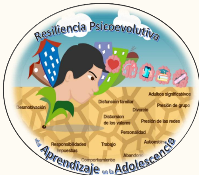
Gráfico 1 Holograma Holístico del episteme generado en la investigación

educación: el Hogar, la Familia, quienes han adoptado nuevas formas de orientar a sus hijos, que dejan mucho que pensar en cuanto al rol de los padres como adultos significativos y su nivel de compromiso con el bienestar de los suyos.